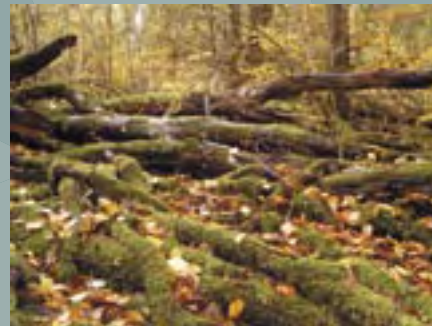
Totholz bietet einen Lebensraum für unzählige Pflanzen, Vögel, Kleinsäuger und Insekten.

Neben der biologischen Vielfalt werden aber auch die natürliche genetische Vielfalt der Waldbäume und damit auch die Genressourcen bewahrt. Letztendlich spielen NWR auch als Forschungsobjekte eine wichtige Rolle. Die Wissenschaft will dabei Grundlagen über die Waldentwicklung auf verschiedenen Standorten erarbeiten, aber auch praktische Erkenntnisse für den naturnahen Waldbau und eine effiziente Waldwirtschaft gewinnen.