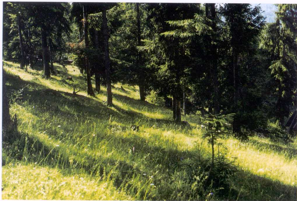
Abb. 6. Als Waldweide genutzter Bergfichtenwald bei Scărișoara-Ghețar (Siebenbürgische Westgebirge): Fundort von Histopona laeta .

eine endogäische bzw. troglophile Lebensweise eindeutig aus. Der Fundort des Männchens liegt in einem sehr lichten bzw. ausgelichteten Bergfichtenwald (Exposition NO, Hangneigung etwa 20°), in unmittelbarer Nähe der Gemeinde Scărișoara-Ghețar (bekannt durch die größte und bedeutendste Eishöhle Siebenbürgens). Der untersuchte Standort (Abb. 6) wird als Waldweide genutzt und grenzt an ebenfalls extensiv bewirtschaftete, wechsellrockene Kalk-Magerrasen.