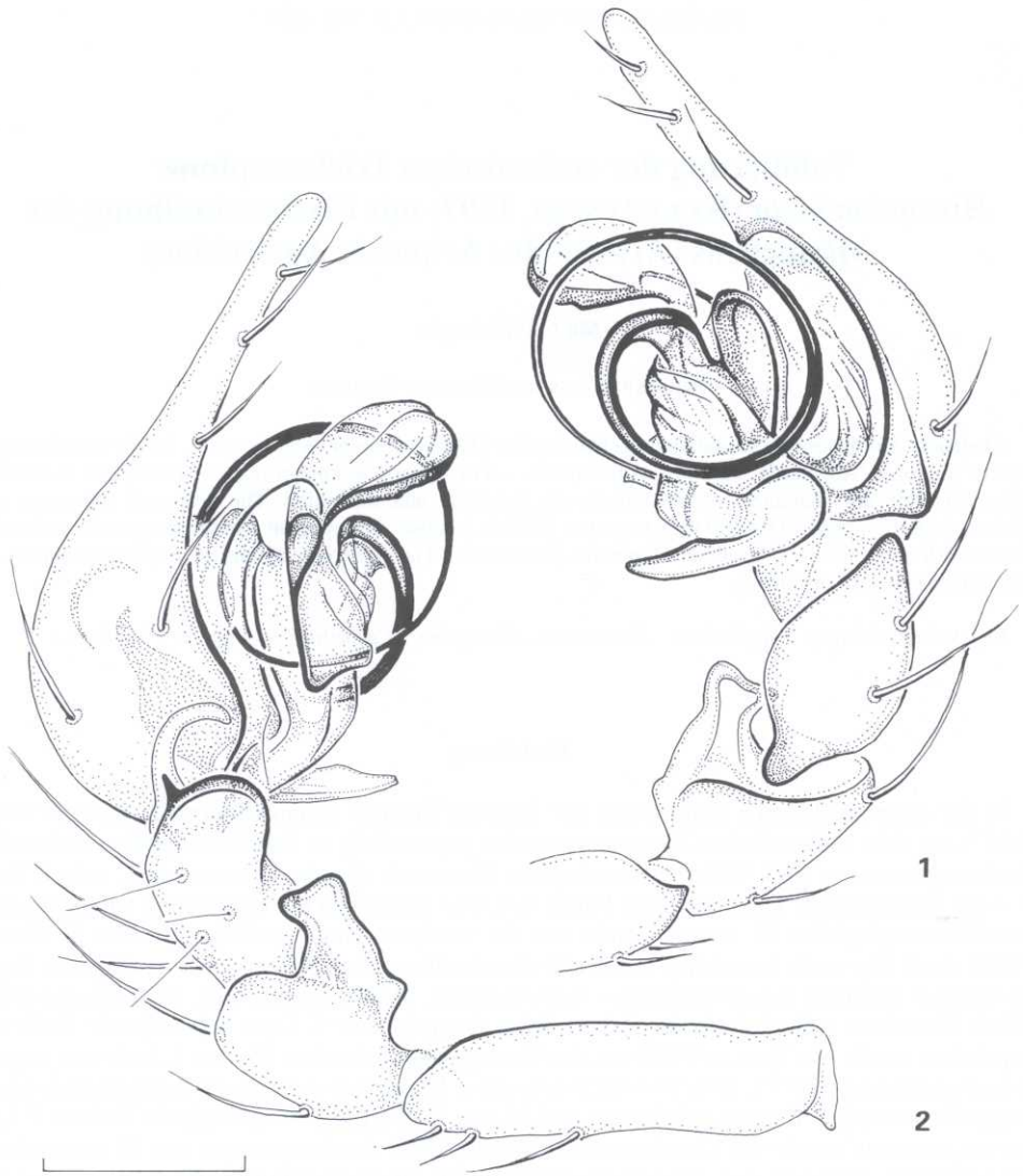
Abb. 1–2. Histopona laeta (KULCZYNSKI). Rechter ♂-Pedipalpus von prolateral (1) und retrolateral (2). (Scărișoara-Ghețar). Maßstab: 0,5 mm

Material: Rumänien, Domogled (Herkules-Bad = Băile Herculane), Wald, Handfang, 03.09.1984, 1 ♀, leg. Weiss (Naturwiss. Mus. Hermannstadt-Sibiu, Nr. 14. 6.1/13–3 727); Siebenbürgisches Westgebirge (Munții Bihor), Scărișoara – Ghețar (Kreis Weißenburg – Jud. Alba), Waldrand-Waldweide, schattige Bereiche, Bodenfallen 12.–17.07.1997, 1 ♂, leg. Rușdea (Biologiezentrum des OÖ Landesmuseums Linz-Dornach).